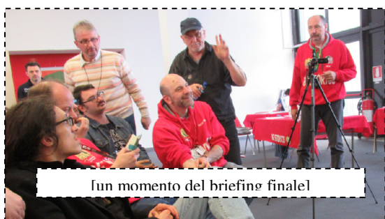
Un momento del briefing finale

Come posso imparare un gioco in pochi minuti? premesso che non è affatto complesso, per ogni fazione saranno presenti i game controllers che daranno indicazioni, chiarimenti, supporto ai giocatori... Lo staff sarà sempre presente... ma interverrà solo se richiesto.